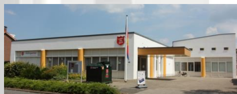
De Verbinding, Hofveld 21-23, 7331KB in Apeldoorn www.legerdesheils.nl/korpsapeldoorn www.facebook.com/LegerdesHeilskorpsApeldoorn