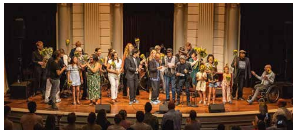
De afsluiting met dankbaarheid en zonnebloemen